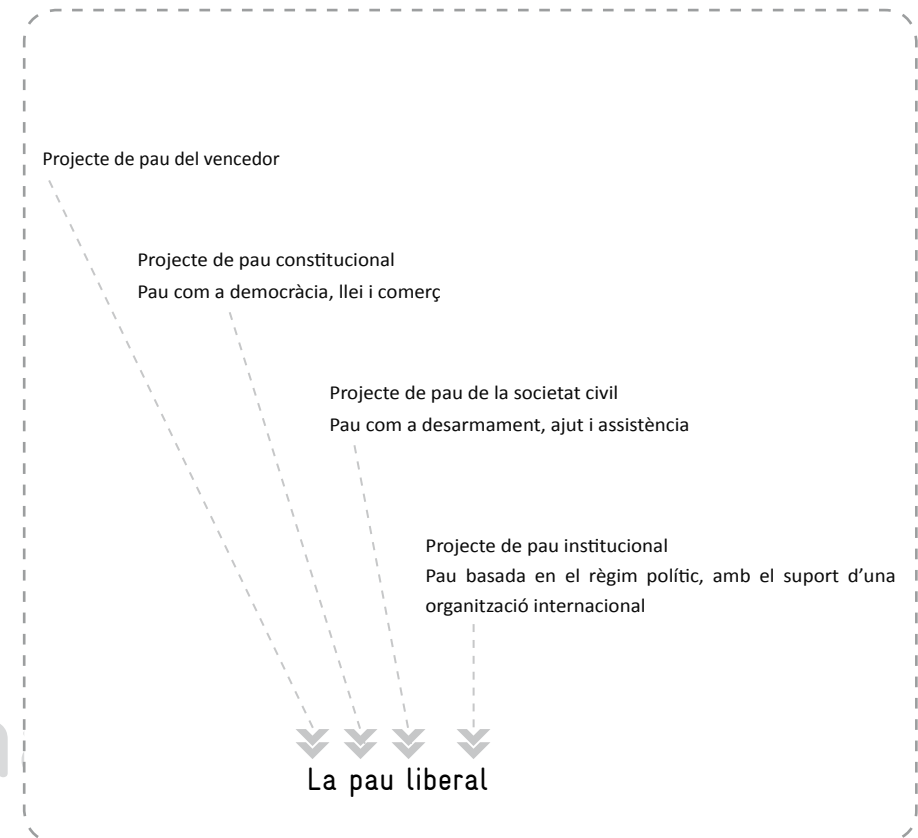
Figura 9: La pau liberal.

del vencedor, del govern dels savis per evitar la guerra, de les treves i els tractats per posar fi als conflictes armats, de la consciència dels avantatges d'assolir la prosperitat i l'abundància, i d'un paper creixent dels moviments religiosos i socials que predicaven el pluralisme i pacifisme filosòfics.