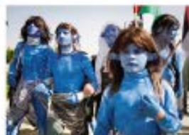
1 Polémicas Azules The Blue Lives Matter protests, 2016

En 2016, un grupo de personas se pintó el cuerpo de azul y se paró en las calles de varias ciudades estadounidenses para protestar por la violencia policial contra los afroamericanos. El movimiento se convirtió en un símbolo de apoyo a la policía y se enfrentó a críticas por ser racista.