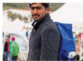
3 Big Man Project , 2013

Este lanzamiento fue un hito tecnológico que generó gran interés entre los usuarios de Hong Kong. El evento destacó la innovación y la conectividad que ofrecía el BlackBerry.