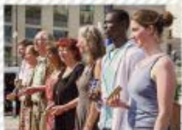
5 The BlackBerry in Hong Kong , 2013

El lanzamiento del BlackBerry en Hong Kong, 2013, fue un evento que marcó la entrada de esta tecnología en el mercado asiático. Se celebró una presentación que destacó las características del dispositivo.