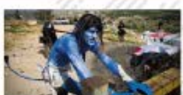
6 Electronic Disturbance Theater , 2000

El Electronic Disturbance Theater, 2000, fue una iniciativa que buscó promover la participación de los artistas en actividades de activismo digital. Se realizaron performances que cuestionaron el poder y la tecnología.