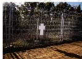
2 First Fall of the European Wall Center for Historical Memory, 2014

Este taller buscó empoderar a las mujeres a través de la creación de redes de apoyo y la promoción de sus talentos. Se realizaron actividades que fortalecieron la identidad colectiva y el compromiso con la comunidad.