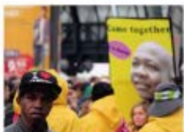
4 The Women of Longosada Taller de los días del Festival de la Primavera, 2017

El taller de los días del Festival de la Primavera en Longosada, 2017, fue una actividad que buscó promover la participación de las mujeres en la vida cultural y social de la comunidad. Se realizaron talleres de manualidades y actividades educativas.