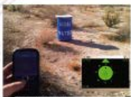
6 Electronic Disturbance Theater , 2000

El Electronic Disturbance Theater, 2000, fue una iniciativa que buscó promover la participación de los artistas en actividades de activismo digital. Se realizaron performances que cuestionaron el poder y la tecnología.