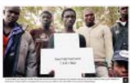
4 The Women of Longosada Taller de los días del Festival de la Primavera, 2017

El taller de los días del Festival de la Primavera en Longosada, 2017, fue una actividad que buscó promover la participación de las mujeres en la vida cultural y social de la comunidad. Se realizaron talleres de manualidades y actividades educativas.