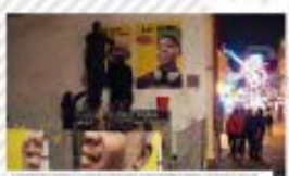
5 The BlackBerry in Hong Kong , 2013

El lanzamiento del BlackBerry en Hong Kong, 2013, fue un evento que marcó la entrada de esta tecnología en el mercado asiático. Se celebró una presentación que destacó las características del dispositivo.