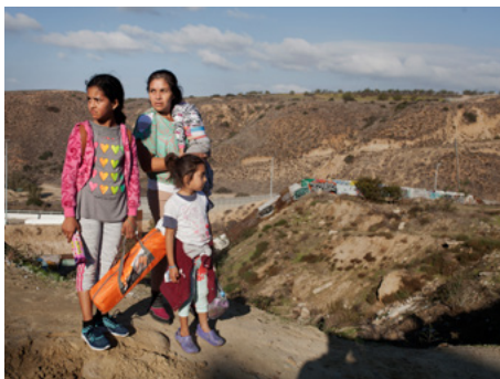
1 Una dona centreamericana i les seves filles caminen cap al mur que separa Mèxic dels Estats Units a la zona de Tijuana per intentar creuar-lo.

La ruta de prop de 4.000 kilòmetres del Triangle Nord cap als Estats Units és escenari d'una crisi humanitària tan greu com desconeguda. A més a més del risc de ser detingudes, les persones que la transiten fan front, cada dia, a tota mena d'abusos i al perill de ser segrestades, torturades, violades o assassinades, especialment per membres del crim organitzat. Els casos de persones desaparegudes en aquestes circumstàncies han augmentat els últims anys.