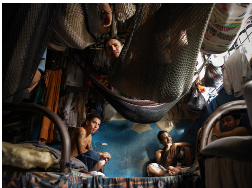
Presó per a membres del Barrio 18 de Cojutepeque, al Salvador. Centreamèrica és una de les regions amb més superpoblació penitenciària del món.