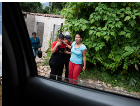
5 Una dona plora en el moment en què el vehicle de medicina forense s'emporta el cadàver del seu marit, assassinat a Soyapango, el Salvador.