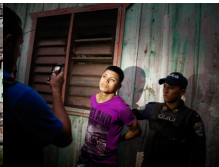
5 Un jove membre de la banda Los Tercerños arrestat in fraganti al barri Rivera Hernández, considerat el més perillós de San Pedro Sula, Hondures.