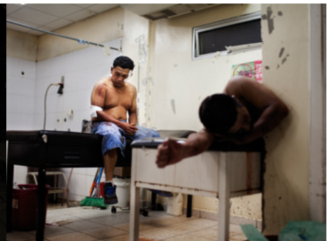
3 Dos homes amb ferides de matxet a la sala d'emergències de traumatologia de l'hospital Mario Catarino Rivas de San Pedro Sula, Hondures.