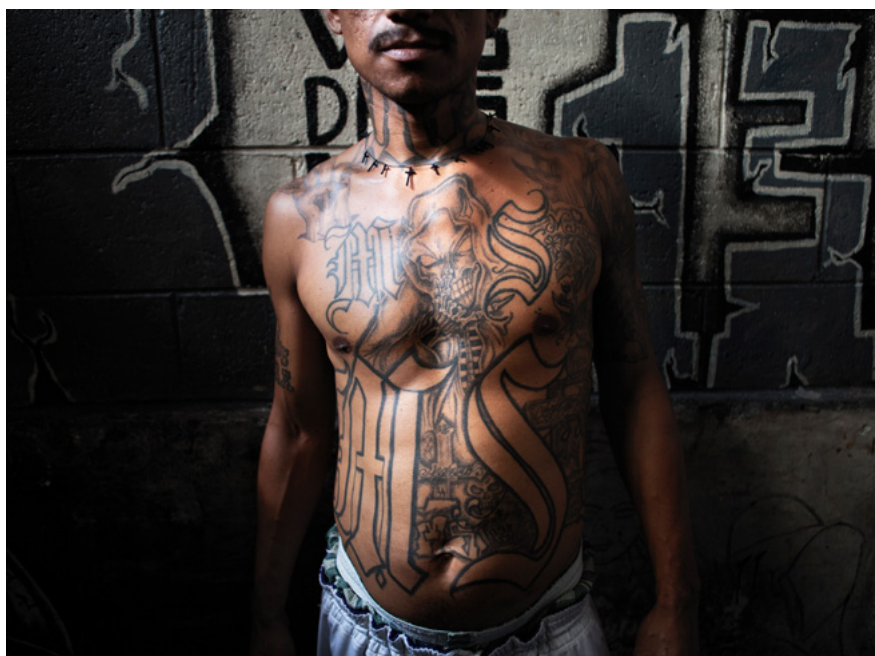
Un membre de la Mara Salvatrucha a la presó de Ciudad Barrios. Al Salvador, les presons estan segregades per bandes a causa de la violència entre elles o envers la població civil.