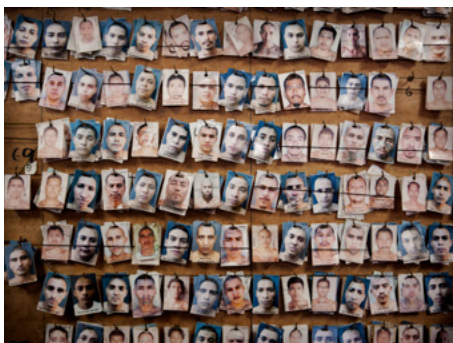
1 Panell rudimentari per controlar la ubicació dels presos a l'interior d'Izalco, presó exclusiva per a membres del Barrio 18 al Salvador.

“Cada vegada que recordo el que jo vaig experimentar, em motivo. Hi ha gent que està esperant aquesta porta de sortida i si jo puc ser part d'aquesta opció, ho seré. Prefereixo morir lluitant que seguir permetent que la mateixa autoritat m'humiliï i em trepitgi quan estic intentant canviar.”