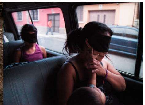
3 Una dona i els seus fills, amb els ulls embenats, són traslladats a un alberg per a víctimes de violència intrafamiliar a Ciutat de Guatemala. Aquest protocol se segueix per evitar que les víctimes canviïn d'opinió i informin l'agressor del lloc on s'allotgen.