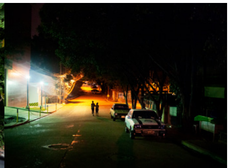
6 Dues joves transsexuals caminen per un carrer de Tegucigalpa durant la nit. La violència contra transsexuals i homosexuals ha arribat a nivells extrems a Hondures.