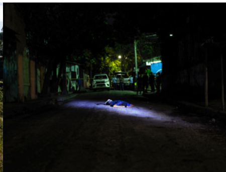
2 El 20 de maig del 2019 es van sentir setze trets a la Colonia San Antonio del Salvador. Més tard, es va trobar el cos d'un jove que estava sent extorsionat per una banda de la zona.