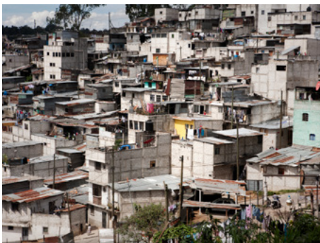
4 Comunitat “El Esfuerzo”, al centre de Ciutat de Guatemala. Aquesta zona marginal a pocs minuts dels gratacels més grans de Guatemala viu sota el control de la “mara” Barrio 18.