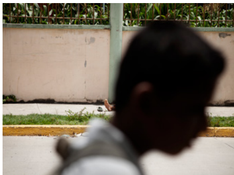
1 Un estudiant passa prop del cadàver d'un jove de divuit anys assassinat a trets davant l'escola del barri Cabañas, a San Pedro Sula, Hondures.

Un dels projectes inicials de CINDE van ser els reforços escolars, donant classes de suport a nens en matemàtiques, llengua i ciències, i acompanyant-los amb l'educació sense violència. El programa va créixer i van poder becar els nens per cursar educació bàsica i secundària. Alguns, fins i tot, han rebut suport de CINDE per fer carreres universitàries.