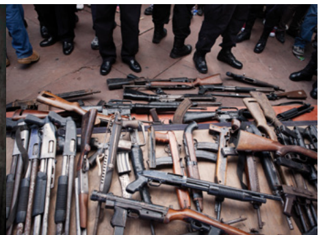
6 Les bandes Mara Salvatrucha i Barrio 18 fan una entrega d'armament a la plaça central de San Salvador com a acte simbòlic en el procés de treva de la violència iniciat el 2012.