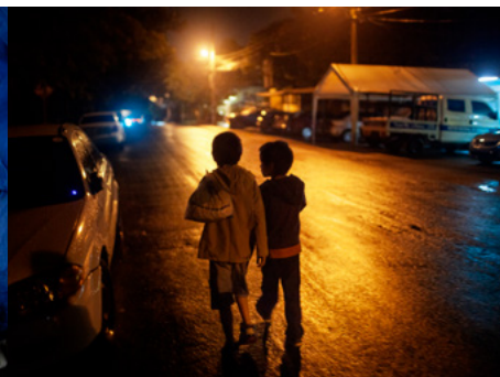
3 Dos nens caminen sols al vespre pels carrers de San Pedro Sula. L'any 2014, aquesta ciutat hondurenca va ser qualificada la més violenta del món.