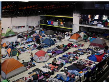
2 Alberg provisional situat en una nau industrial de Tijuana, Mèxic, on centenars de centreamericans es van refugiar durant la caravana migrant de l'any 2018.