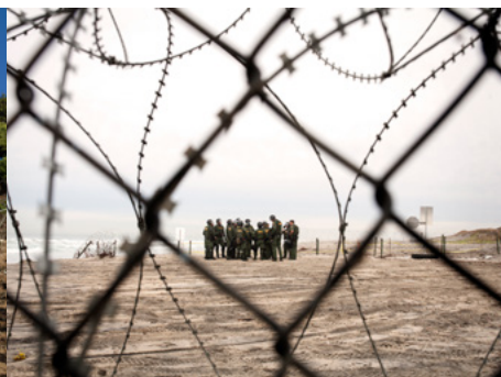
5 Reunió d'un grup d'oficials de la patrulla fronterera dels Estats Units.