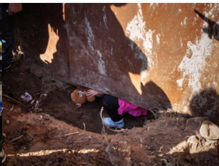
3 Una nena creua el mur fronterer entre Mèxic i els Estats Units per un forat que han excavat els seus pares.