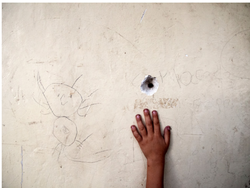
Un forat de bala a la paret on juguen els nens del Bajo Aguán, Hondures, recorda el conflicte violent per l'accés a la terra que enfronta camperols, policia i grans terratinents i que, del 2008 al 2013, va deixar 128 persones assassinades.