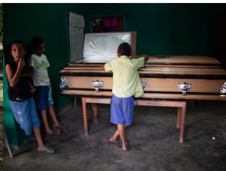
5 Nens observant un fèretre obert durant una vetlla funerària al municipi de Tocoa, Bajo Aguán, Hondures.