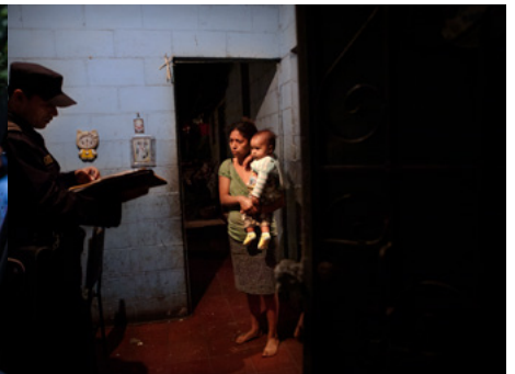
3 Un policia comunica a una dona que el seu marit ha estat arrestat durant un operatiu policial contra les “maras”, i que serà acusat d'homicidi.