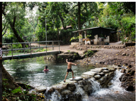
6 Dues noies juguen al riu Acelhuate, el més contaminat del Salvador, al municipi de Nejapa, una zona amb forta presència de la “mara” Barrio 18.