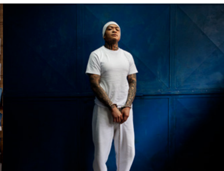
2 Jorge Yahir de León Hernández, conegut com “El Diabólico”, és el líder nacional de l'organització criminal Mara Salvatrucha-13 a Guatemala. Actualment, resideix a la presó de màxima seguretat de Fraiganes II, a Ciutat de Guatemala.