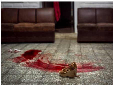
1 Escena d'un homicidi als afores de San Salvador. El maig del 2019, la propietària d'un bar va ser assassinada per no pagar l'extorsió que li demanava la banda que tenia el control de la zona.

La Col·lectiva Feminista aborda casos de violència a la llar. Ofereix atenció emocional i assessoria legal i promou un programa de xarxes de família solidària que proporciona una llar provisional a dones que fugen de situacions de violència i no tenen on anar. Però la feina més visible de l'organització és la lluita per la despenalització de l'avortament, sobre el qual el Salvador té una de les lleis més dures del món. Actualment hi ha setze dones salvadorenques a centres penitenciaris per aquest delictes, amb condemnes tipificades com a homicidi agreujat que arriben fins als trenta anys de presó.