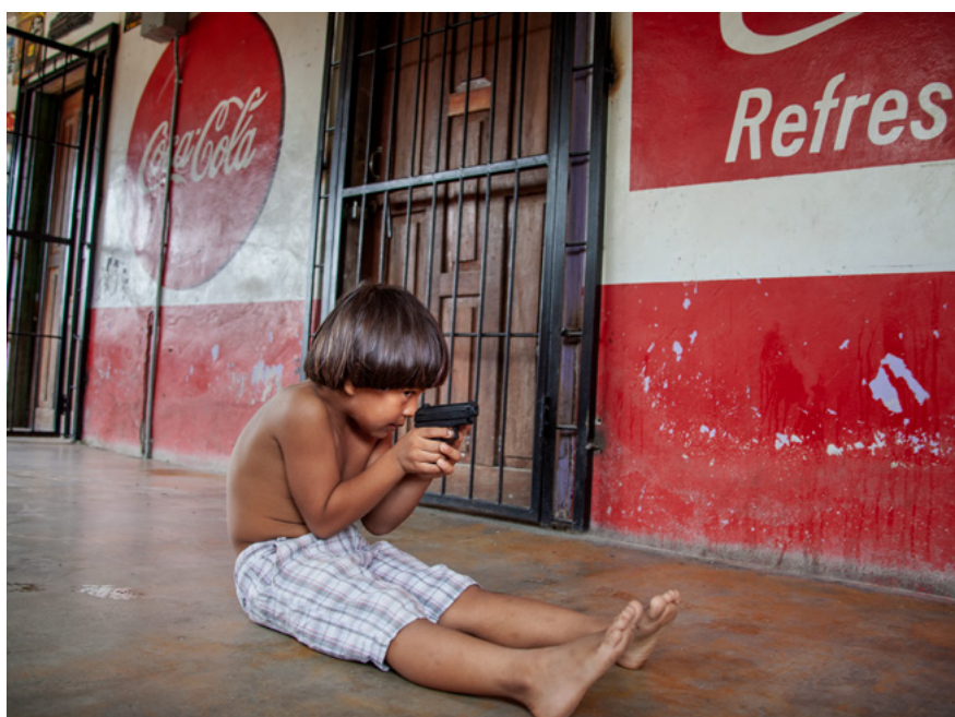
Un nen juga amb una pistola de joguina en una botiga d'alimentació al Bajo Aguán, Hondures.