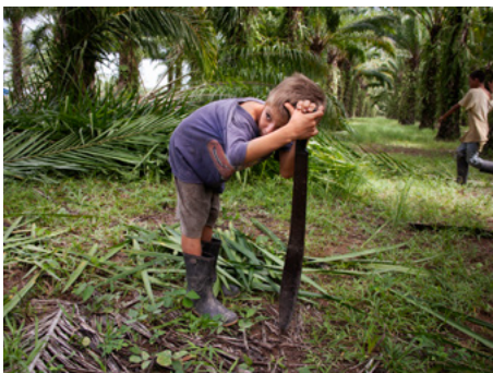
4 Un nen treballa netejant les males herbes d'una plantació de palma africana a la zona del Bajo Aguán, Hondures.