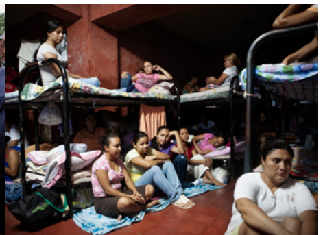
3 Interior d'una de les cel·les de la presó d'Ilopango, principal presó per a dones del Salvador i una de les que té les taxes de superpoblació més altes de Centreamèrica.