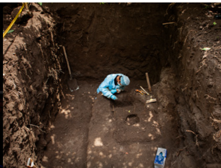
2 Un fiscal especialitzat en desenterrar cadàvers al Salvador neteja els ossos del que sospita que és una dona assassinada i llençada a un pou als afores de San Salvador.