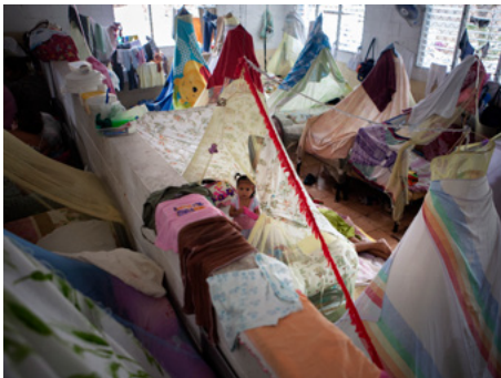
1 A la presó de dones d'Ilopango, al Salvador, hi ha un sector especial per a les mares amb fills petits. Molts van néixer dins de la presó i no han conegut mai el món exterior.

Les guerres civils dels anys 80 i 90 a Centreamèrica van deixar una població traumatitzada. Els seus impactes s’han transmès de generació en generació i afecten fins i tot joves que encara no havien nascut quan va acabar el conflicte armat. La proliferació de les “maras” no és aliena a aquest llegat de violència. Milers de nens i nenes també es troben avui en risc de patir-ne les terribles conseqüències.