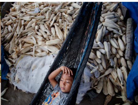
2 Un nen de sis anys va veure com un grup de policies segrestaven el seu germà, de setze anys. Els dos nois viuen a la zona del Bajo Aguán, Hondures, on perdura un conflicte entre camperols, autoritats i grans terratinents pel control de les plantacions de palma africana.