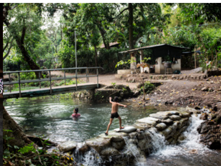
6 Dos chicas juegan en el río Acelhuate, el más contaminado de El Salvador, en el municipio de Nejapa, una zona con fuerte presencia de la mara Barrio 18.