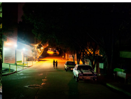
6 Dos jóvenes transsexuales caminan por una calle de Tegucigalpa durante la noche. La violencia contra transsexuales y homosexuales ha llegado a niveles extremos en Honduras.