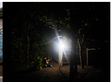
3 Un miembro de la Mara Salvatrucha es arrestado durante un operativo policial. Se le acusa de haber expulsado a una familia de su casa y de haberse instalado en ella.