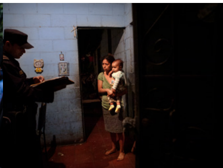
3 Un policía comunica a una mujer que su marido ha sido arrestado durante un operativo policial contra las maras, y que será acusado de homicidio.