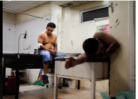
3 Dos hombres con heridas de machete en la sala de urgencias de traumatología del hospital Mario Catarino Rivas de San Pedro Sula, Honduras.