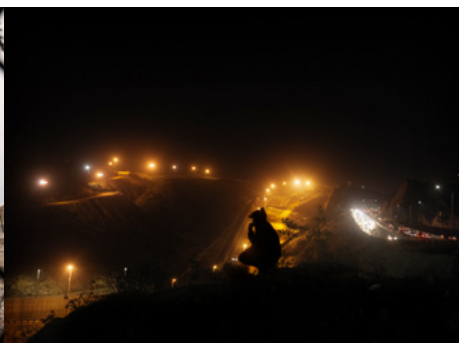
6 Un joven hondureño de 25 años espera el mejor momento para cruzar el muro de Estados Unidos. Intentarlo de noche es más peligroso, pero reduce las posibilidades de ser arrestado.