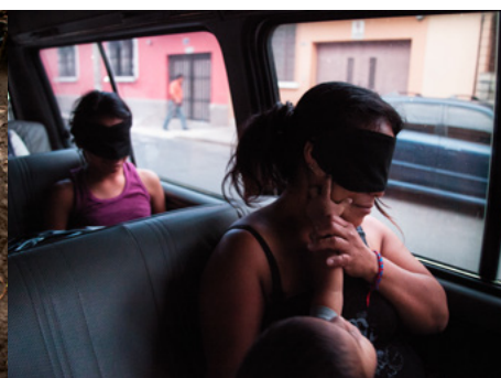
3 Una mujer y sus hijos, con los ojos vendados, son trasladados a un albergue para víctimas de violencia intrafamiliar en Ciudad de Guatemala. Este protocolo se sigue para evitar que las víctimas cambien de opinión e informen al agresor del lugar donde se alojan.