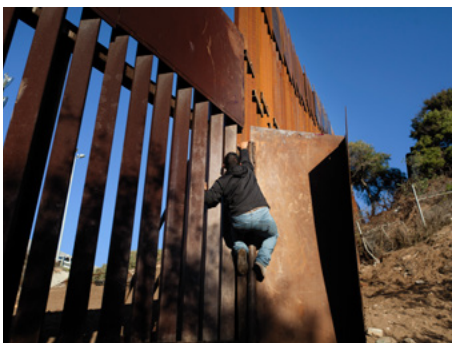
4 Un hombre escala el muro fronterizo en la zona de Tijuana en un intento de saltarlo. Durante la caravana del 2018, la desesperación hizo que muchos migrantes cruzasen para entregarse inmediatamente a la patrulla fronteriza de Estados Unidos.