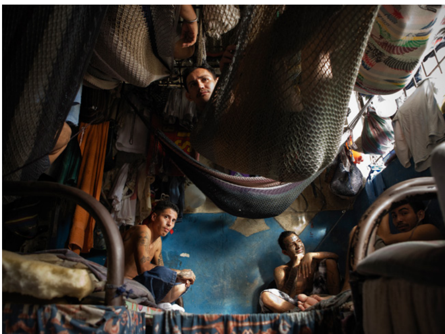
Cárcel para miembros del Barrio 18 de Cojutepeque, en El Salvador. Centroamérica es una de las regiones con más superpoblación penitenciaria del mundo.