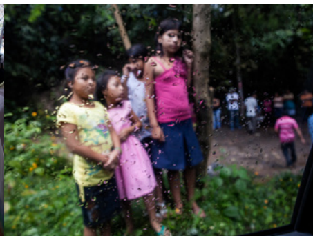
2 Un grupo de niñas observa la llegada de la camioneta de medicina forense en los alrededores de Soyapango. En las zonas más violentas de El Salvador, los niños saben que la llegada de este vehículo significa que alguien ha sido asesinado.