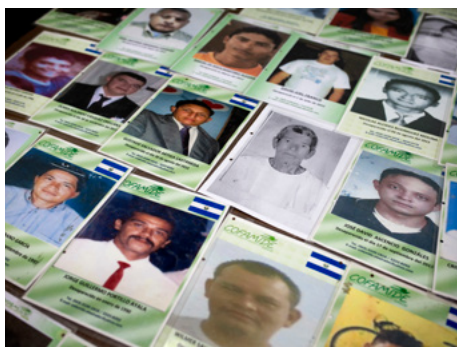
1 Carteles de migrantes salvadoreños desaparecidos durante su travesía hacia Estados Unidos. Desde el 2014 han muerto o desaparecido más de 3.000 personas en esta ruta migratoria.

Entre sus recuerdos más significativos está el de una mujer de las caravanas que dio a luz en la Casa del Migrante. «Nos podemos preguntar por el futuro de este niño, que no tuvo ni una casa donde nacer dignamente.» En la mayoría de los casos, Mauro no vuelve a tener noticias de las personas que pasan por su albergue. Él les ofrece ayuda para hacer más fácil su camino, esperando que tengan suerte en su éxodo.