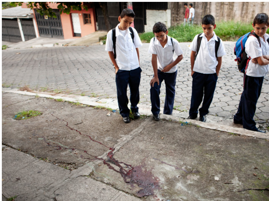
Un grupo de estudiantes contempla la sangre que ha dejado el cadáver de otro estudiante asesinado en el municipio de Soyapango, en El Salvador.