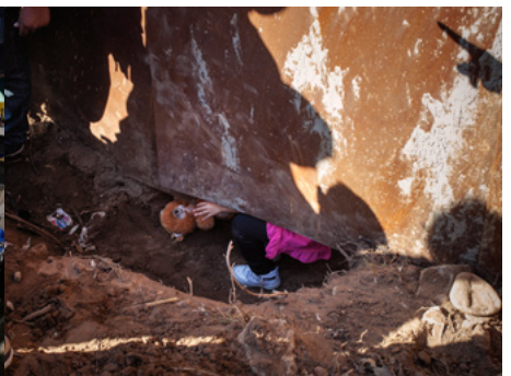
3 Una niña cruza el muro fronterizo entre México y Estados Unidos por un agujero que han excavado sus padres.