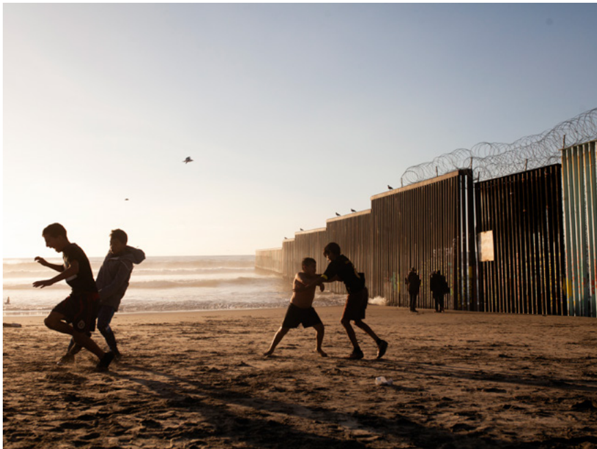
Un grupo de niños juegan a pelearse delante del muro que separa México de Estados Unidos en la zona de Playas de Tijuana.