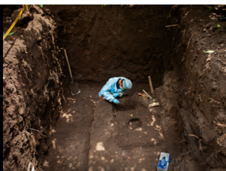
2 Un fiscal especializado en desenterrar cadáveres en El Salvador limpia los huesos de lo que sospecha que es una mujer asesinada y lanzada a un pozo en las afueras de San Salvador.