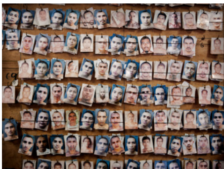
1 Panel rudimentario para controlar la ubicación de los presos en el interior de Izalco, cárcel exclusiva para miembros del Barrio 18 en El Salvador.