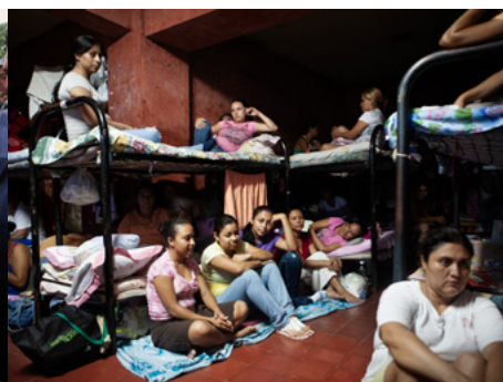
3 Interior de una de las celdas de la cárcel de Ilopango, principal prisión para mujeres de El Salvador y una de las que tiene las tasas de superpoblación más altas de Centroamérica.