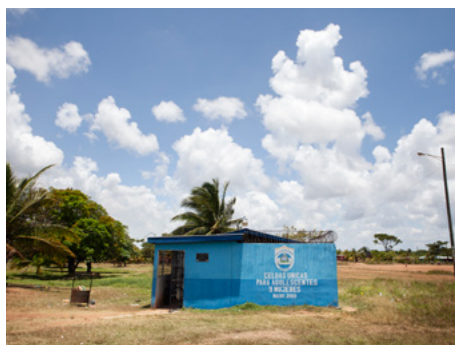
4 Celdas policiales exclusivas para mujeres y adolescentes en la región de la Mosquitia caribeña, Nicaragua.