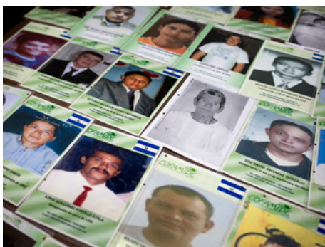
1 Cartells de migrants salvadoreny des- apareguts durant la seva travessa cap als Estats Units. Des del 2014 han mort o desaparegut més de 3.000 persones en aquesta ruta migratòria.