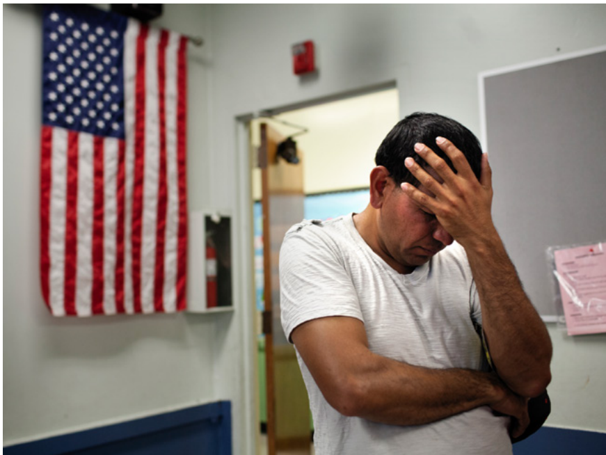
En Misael, un salvadoreny indocumentat, resa abans de sopar al menjador comunitari de Misión Dolores, a Los Angeles. Molts centreamericans indocumentats acaben vivint als carrers quan arriben als Estats Units.