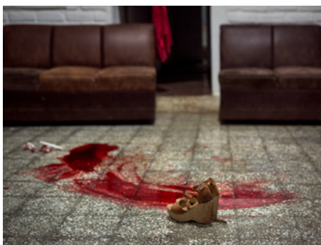
1 Escena d'un homicidi als afores de San Salvador. El maig del 2019, la propietària d'un bar va ser assassinada per no pagar l'extorsió que li demanava la banda que tenia el control de la zona.

La Col·lectiva Feminista aborda casos de violència a la llar. Ofereix atenció emocional i assessoria legal i promou un programa de xarxes de família solidària que proporciona una llar provisional a dones que fugen de situacions de violència i no tenen on anar. Però la feina més visible de l'organització és la lluita per la despenalització de l'avortament, sobre el qual el Salvador té una de les lleis més dures del món. En els últims anys, disset dones han sigut condemnades a penes de fins a trenta anys de presó per homicidi agreujat després d'haver avortat.