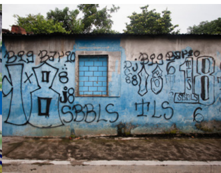
2 Al municipi de Lourdes, prop de San Salvador, barris sencers es troben buits de famílies que han hagut de fugir per la forta presència de bandes a la zona.